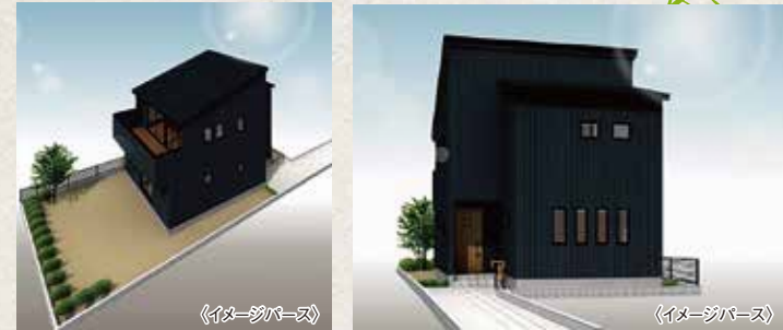
※イメージベースにつき実際とは異なります。